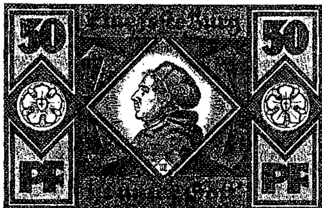
GRÖSSEARTHECOMR.W.FRIEDRICH BRESLAU 1