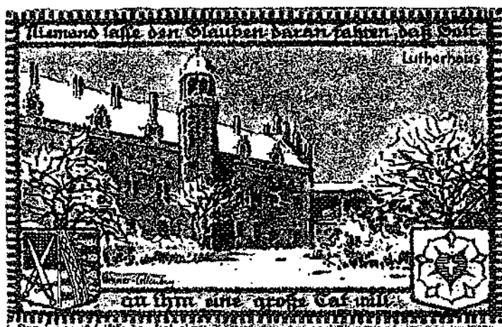
Afbeelding 7 (Lutherhaus) : 50 Pfennig

Ook de keerzijden van deze biljetten zijn zeer verzorgd en stellen plaatsen voor uit de omgeving waarin Luther leefde, zoals het Lutherhaus , de Lutherstube en de Lutherkanzlel .