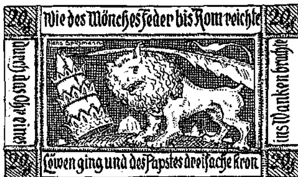
Afbeelding 16 : 20 Pfennig

Het laatste biljet toont een vrij slecht nagetekend portret van Luther uit 1529 met de volgende tekst "Wie der Traum zu Wahrheit ward. Gottes Wort und Luthers Lehr vergehen nun und nimmer mehr".