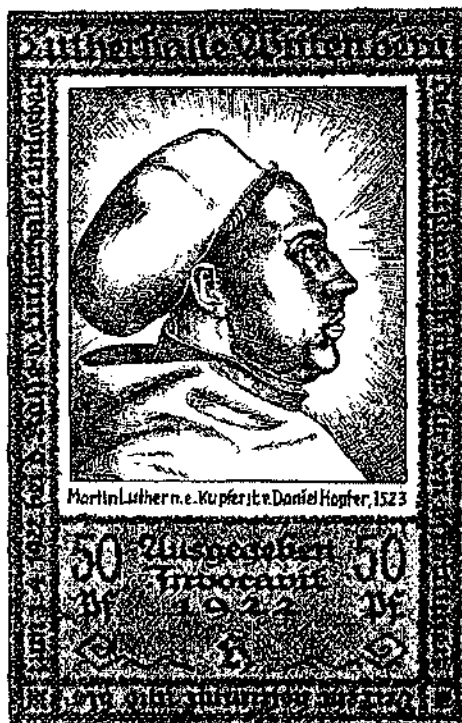
Afbeelding 5 en 6 : 50 Pfennig