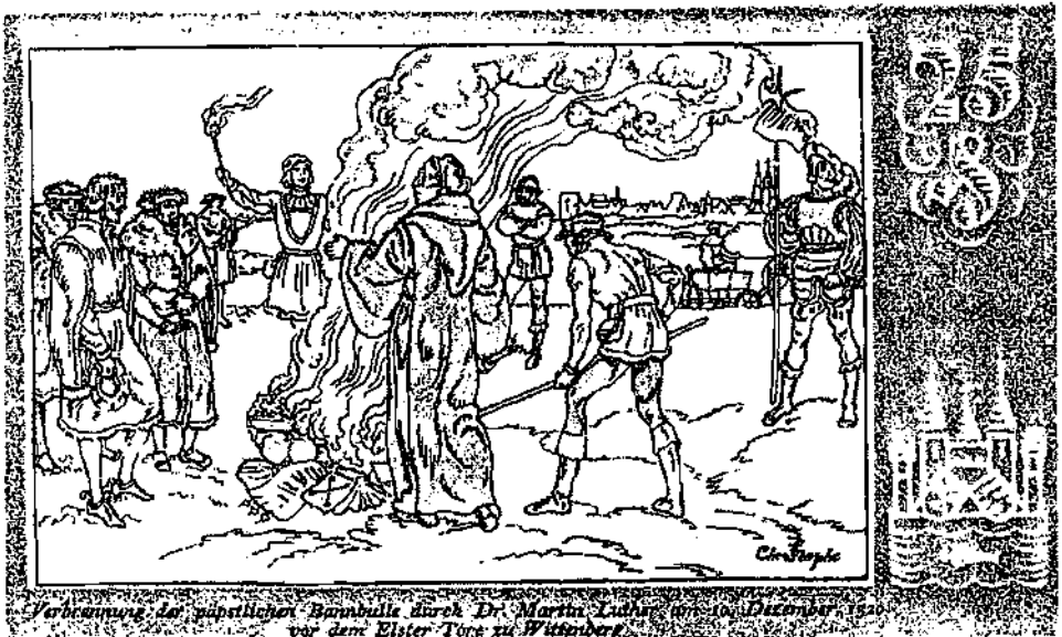
Verbranding der päpsteliker Bannbulle durch Dr. Martin Luther am 10. Dezember 1520 vor dem Elster-Tore zu Wittenberg.