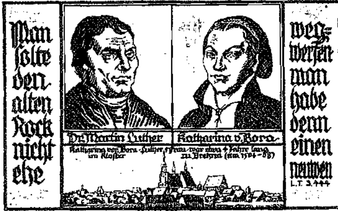
Afbeelding 12 : 50 Pfennig